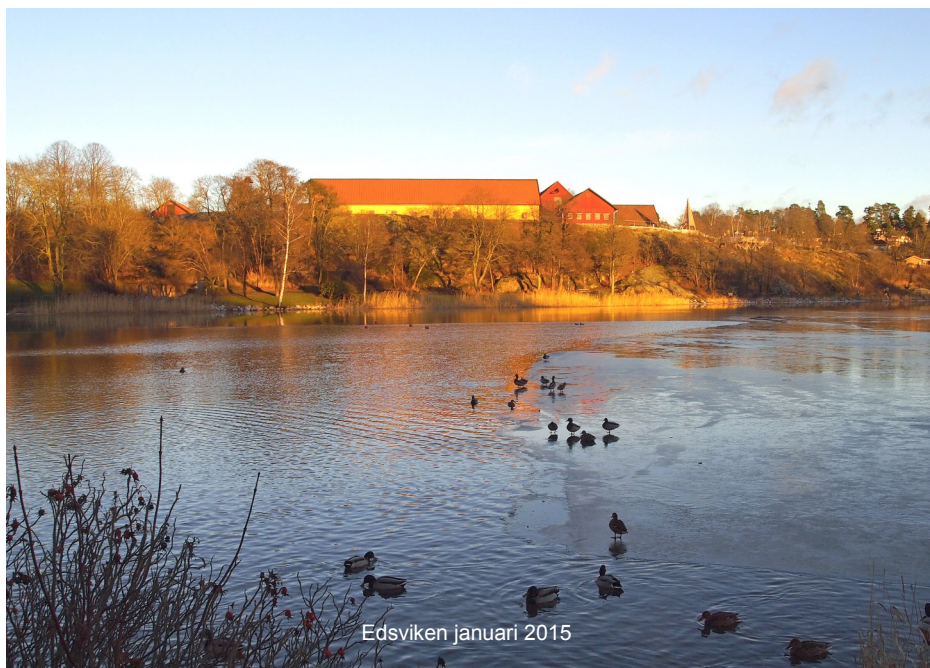
Edsviken januari 2015