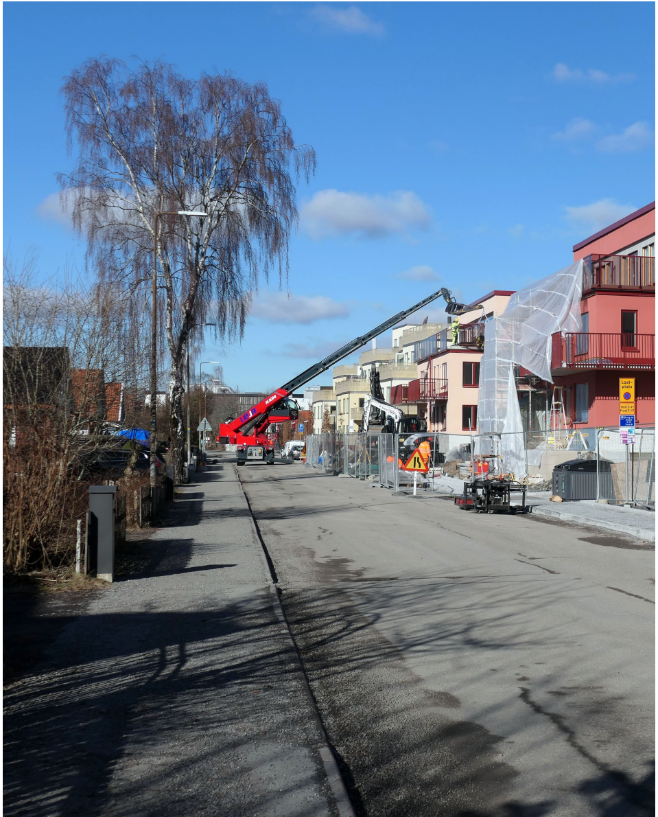
Sollentuna växer - Brf Skimret (bilden tagen från Industrivägen).

POSTTIDNING B SPF Seniorerna Tunasol Box 834, 191 28 Sollentuna