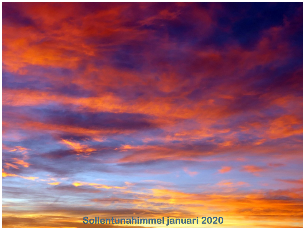
Sollentunahimmel januari 2020