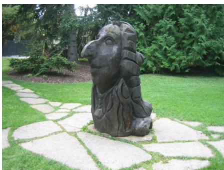
Skulptur föreställande Carl von Linné