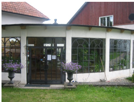
Receptionen på Suderby