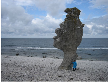
Nefertiti eller? Stor i alla fall

Vi åkte vidare, passerade Ekeviken och nästa stopp blev hos Sylvis döttrar. Ett café och hembageri som under somrarna bakar ca 3 000 bullar per dag vilka säljs direkt från butiken.