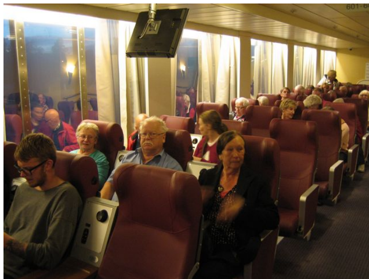
Äntligen på väg över

Vi for med bussen direkt till Suderbys herrgård, för incheckning och sen var det bara att krypa i säng.