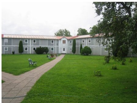
Hotellängan från vinter-os i Lillehammer 1994