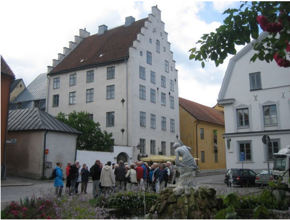
Trappgavelhus vid Strandgatan