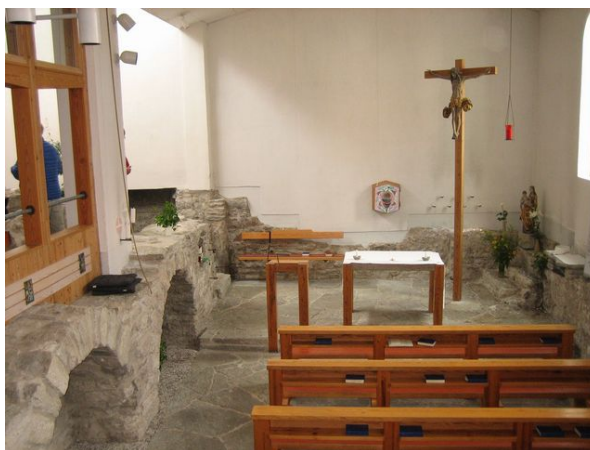
gårdsbrunnen in som kyrkans dopbrunn

Interiör från Kristi lekamens katolska kyrka. Det synliga murverket av kalksten i kyrkan är medeltida. Även delar av stengolvet liksom koringången och trappan i koret är medeltida. I trappan i koret är en sten från Marias hus i Efesos inmurad. I samband med kyrkoutvidgningen 2001 byggdes den medeltida