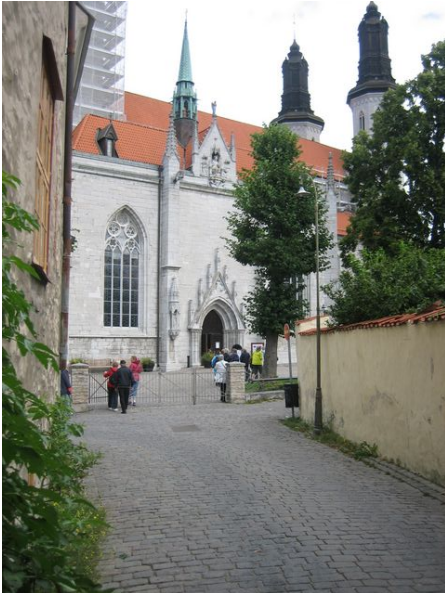
Domkyrkans entré och två av dess torn

Promenaden gick vidare mot stora torget. Där ligger Sankta Karins kyrkoruin. Kyrkan byggdes ursprungligen av franciskanerorden för Visby konvent som grundades 1233. Ursprungligen bestod kyrkan av en långsmal, enskeppig kyrka med avsmalnande kor och höga, rundbågiga fönster. Ett av dessa fönster, numer igenmurat, kan ännu ses i kyrkans västparti. Den nya kyrkan, vars syd- och västpart ingår i nuvarande byggnad, stod klar ca 1250 och fick S:ta Katarina av Alexandria som skyddshelgon. Kyrkan stod mitt i staden och framför byggnaden uppstod en marknadsplats.