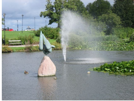
Dammen i Almedalen

Rundvandringen fortsatte in genom Lilla Strandporten till Packhusplan, ett torg som en gång i tiden var stadens medelpunkt och hette Rolandstorget. Genom åren har torget skiftat namn men av äldre kartor framgår att det under lång tid ända fram till mitten av 1800-talet benämndes Fiskartorget. I slutet av 1800-talet iordningställdes en mindre plantering med en fontän och i den en bronsskulptur föreställande ymnighetsgudinnan. Torget är det äldsta i Visby.