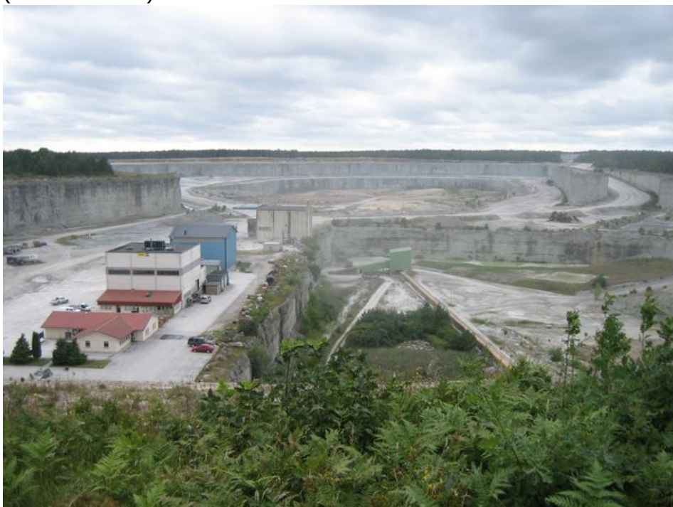
Cementas kalkbrott i Slite

Fårö har växlande natur. Från västra sidans karga och vindpinade växtlighet, raukar och stenar till östra sidans mera bördiga natur. Tillbaka på Gotland åkte vi på östra sidan av ön och stannade i Slite och tittade på Cementas anläggning med kalkbrottet (fantastiskt stort).