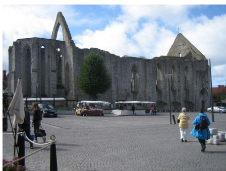
Sankta Karins kyrkoruin vid stora torget