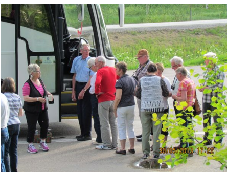
Efter lite egna strövtåg i staden startades återfärden hemåt med ett glatt bussgäng som fått en trevlig, välorganiserad dag, ordnad av våra egna reseledare. Som bonus bjöd dagen på vackert sommarväder.